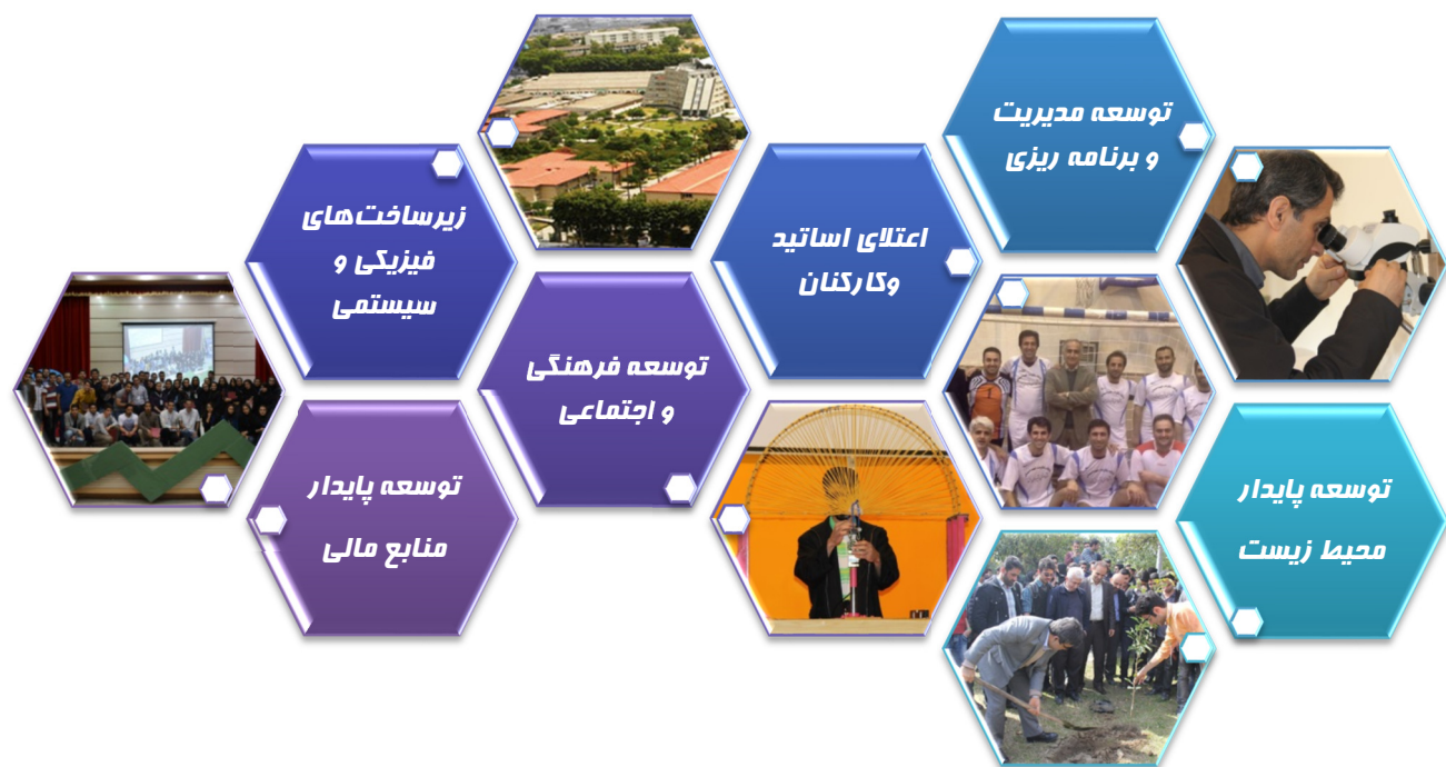
شکل ۴. راهبردهای توانمندساز دانشگاه صنعتی نوشیروانی بابل