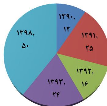
شکل ۳: تعداد پروژه‌های با سازمان‌های همکار در هر سال

دانشگاه به عنوان یک نهاد دانش‌بنیان باید ضمن آگاهی از سطح دانش آشکار و مستند قابل تجاری‌سازی خود، به ثبت و حفاظت از مالکیت معنوی کلیه ذی‌نفعان خود بپردازد و ارزش‌ها و آموزش‌های مرتبط با آن را در میان دانشجویان، فارغ‌التحصیلان و همکاران و ذی‌نفعان خود توسعه دهد.